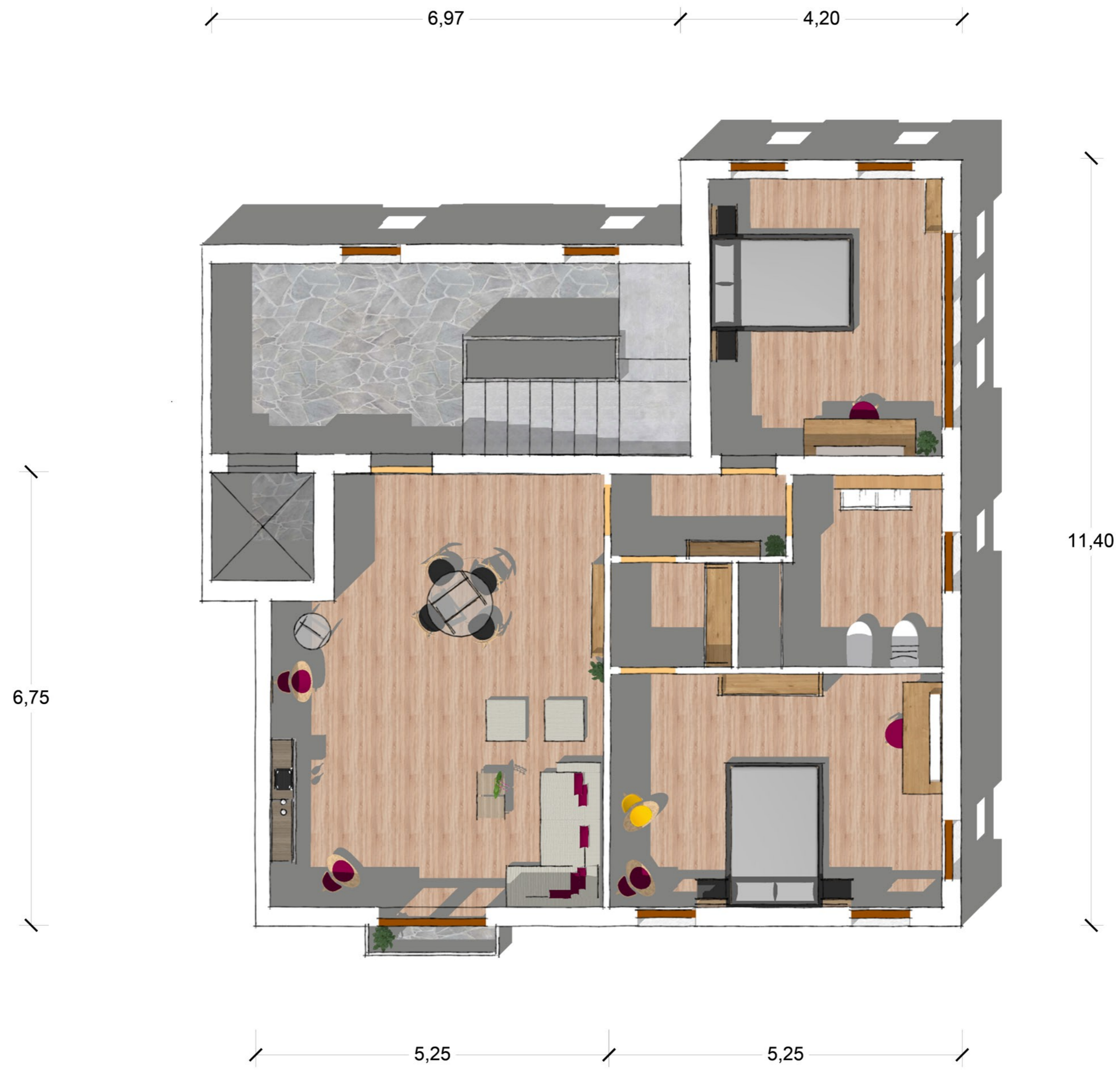
PIANO SECONDO sc. 1:25